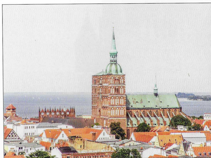
Blick über die Stralsunder Altstadt. (Seite 24)