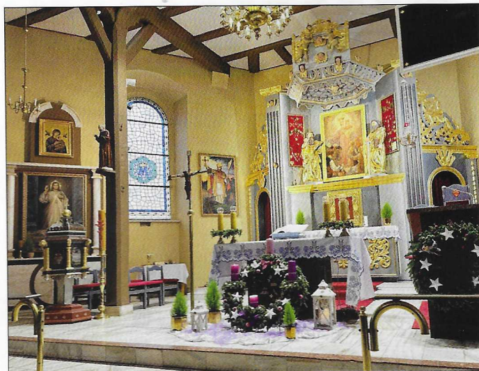
Altarraum in der Rummelsburger Kirche. (Seite 4)