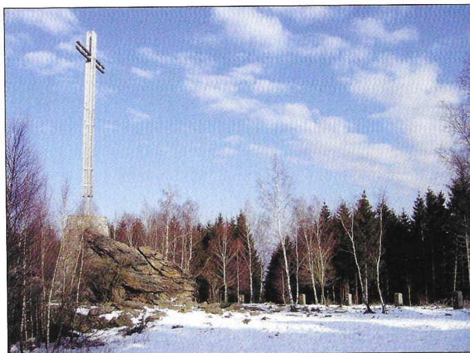
Das „Kreuz des deutschen Ostens“. (Seite 18)