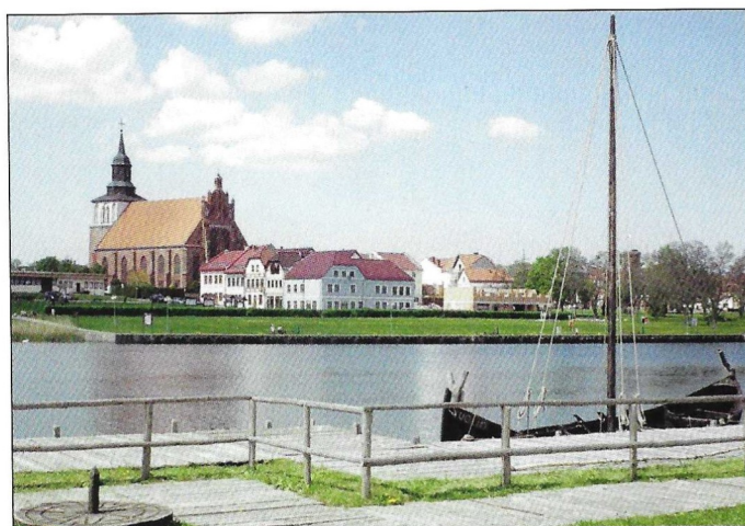
Blick auf Wollin. (Seite 20)