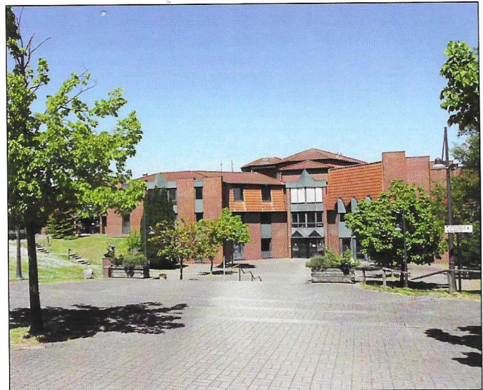
Blick auf die Ostsee-Akademie im Pommern-Zentrum. (Seite 4)