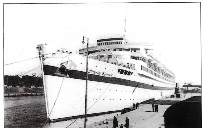
Die „Wilhelm Gustloff“. (Seite 24)