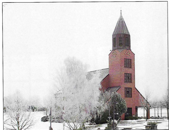
Versöhnungskirche im Pommern-Zentrum. (Seite 15)