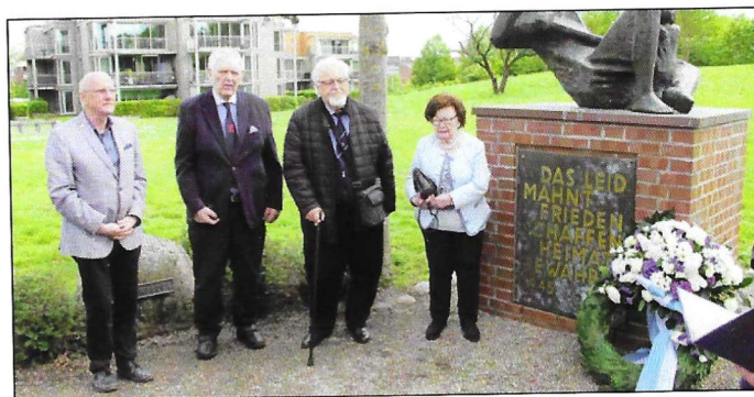
Der Bundesvorstand am Gedenkstein. (Seite 20)