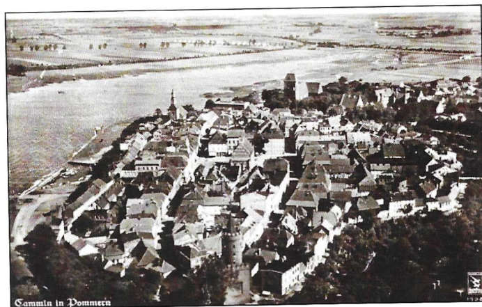
Blick auf Cammin 1941. (Seite 12)