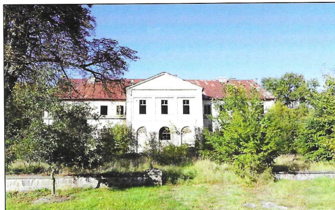
Kniephof, das wohl dem Verfall preisgegeben ist. (Seite 8)