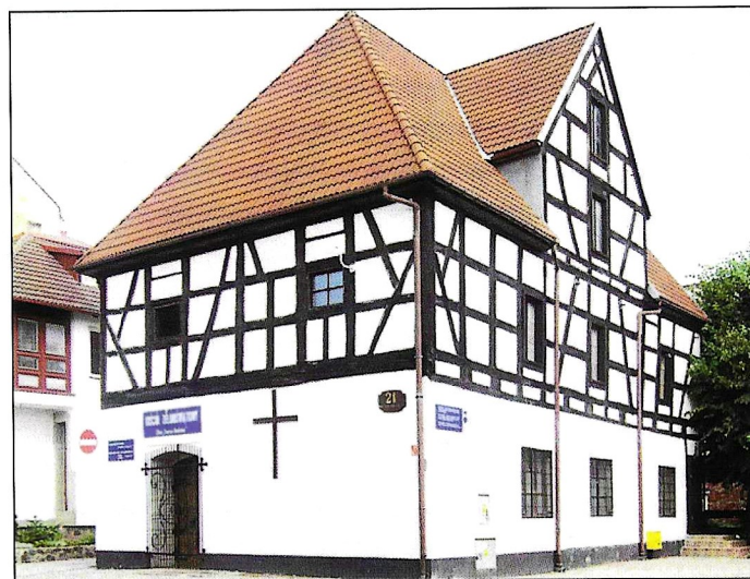
Lauenburg: Alter Salzspeicher. (Seite 18)