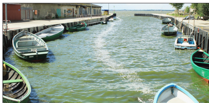
Der Hafen von Lebbin. (Seite 17)