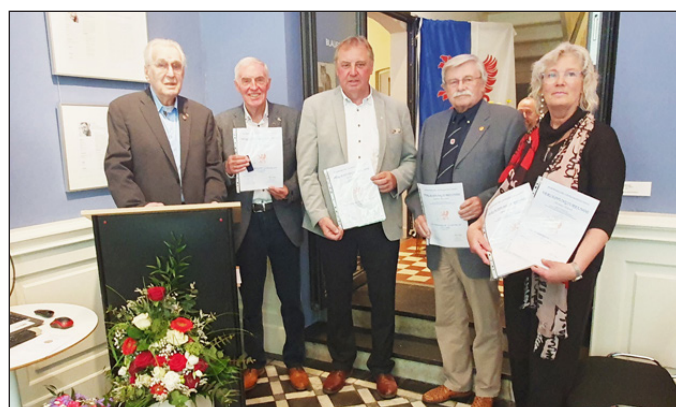
Patenschaftstreffen Bersenbrück – Greifenhagen. (Seite 14)