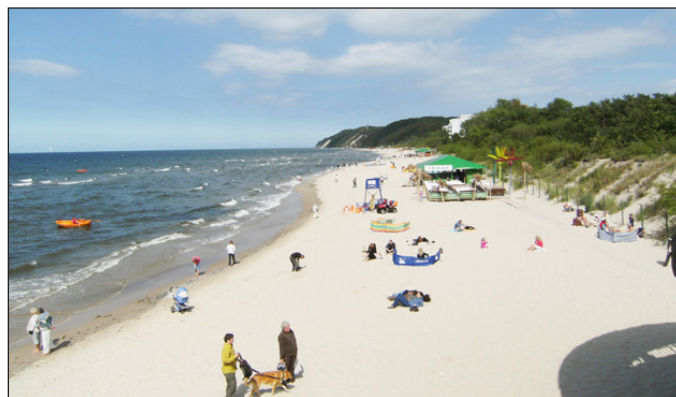
Steilküste in Misdroy. (Seite 13)