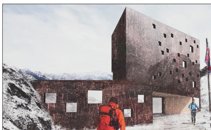
Entwurf der neuen Stettiner Hütte. (Seite 16)