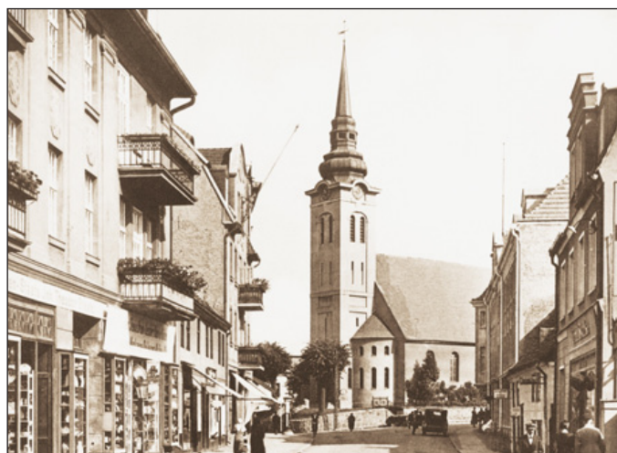
Blick in die Rummelsburger Bahnhofstraße. (Seite 7)