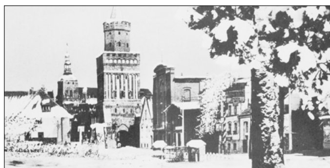
Blick auf das winterliche Pyritz. (Seite 18)