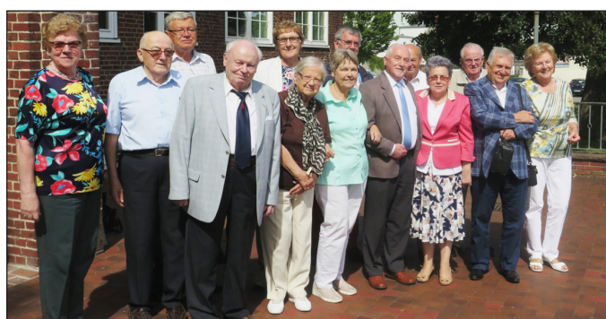
Der neu gewählte Schneidemühler Vorstand. (Seite 16)