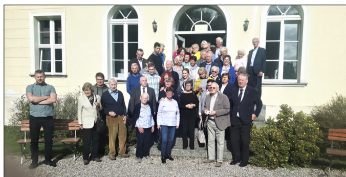
Teilnehmer und Teilnehmerinnen der Verständigungspolitischen Tagung des PKST in Kütz. (Seite 17)